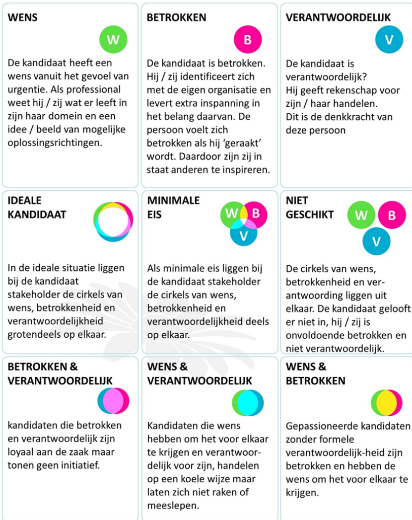
Figuur 1: Stakeholder selectietabel